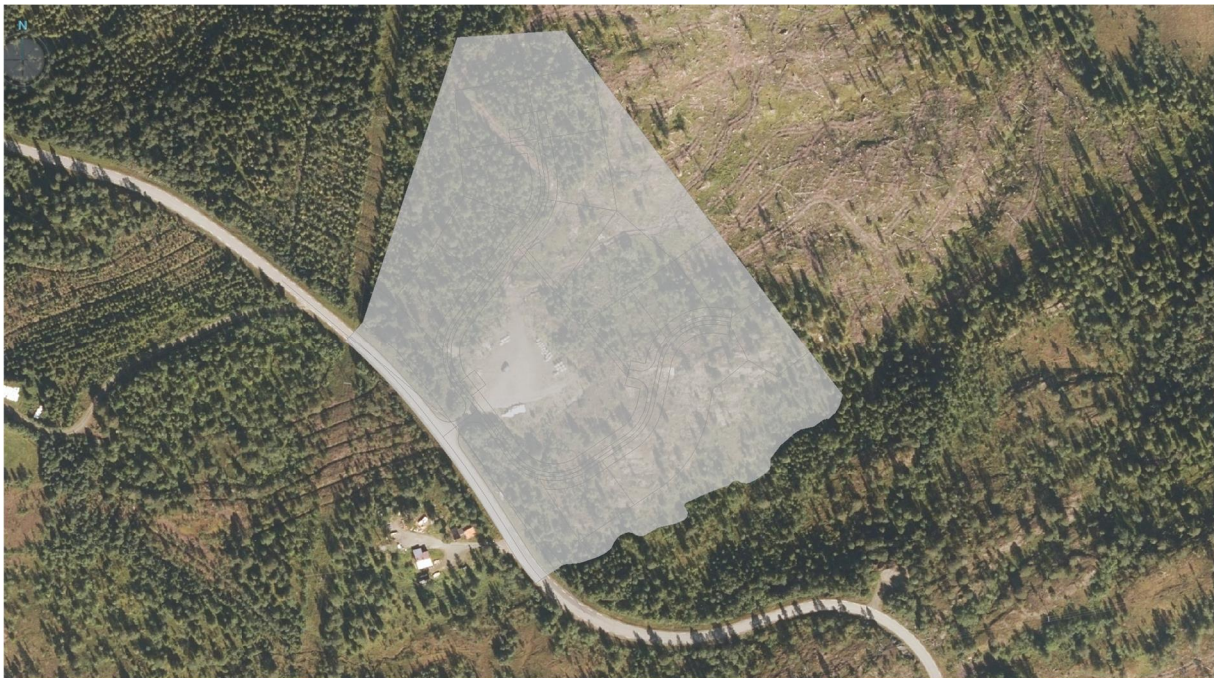
Fig 0 a Regulert område, Google earth 3D