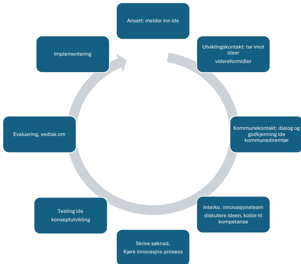
Figur XX. Eksempel på et mulig forløp - fra ide til implementering