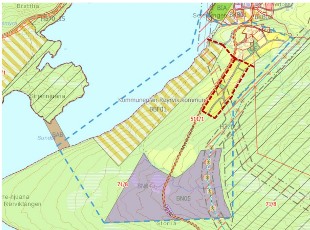
Fig. A – Del av eks. boligområde til blandet formål fritidsbolig/ bolig. (kart GisLink)

Endringen tar utgangspunkt i et naturlig arronderingsmessig og et bruksmessig skille mellom eksisterende boligbebyggelse og områder for mer fleksibel bebyggelse i parallell forlengelse med område BBF01 i kommuneplanens høringsforslag.